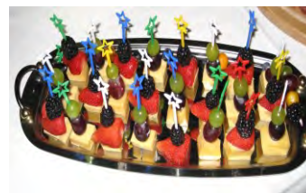
„Käse - Happen“