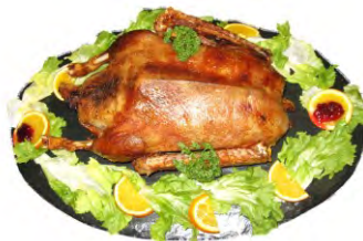
„Thüringer Gänsebraten“ Gefüllt mit Äpfeln...