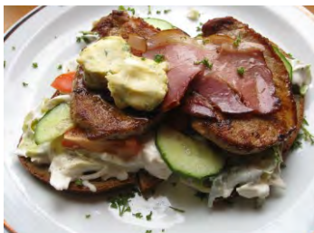
„Fitness-Teller“ Frische für den Sommer