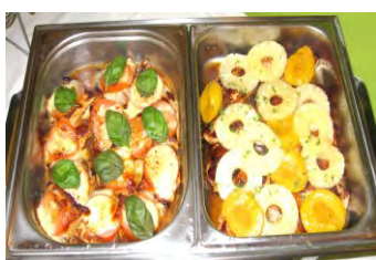
„Hähnchen Mozzarella“ „Hähnchen an gebutterten Früchten“