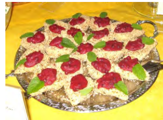
„Kokosbirne“ mit Preiselber-Schaum